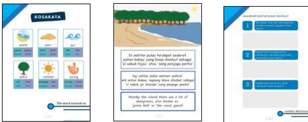
Gambar 3. Tiga Bagian Utama Buku Pintar Trilingual

responding reading melalui beberapa pertanyaan. Tiga bahasa yang digunakan dalam buku pintar trilingual, yaitu bahasa Indonesia, bahasa Jawa dialek Banten, dan bahasa Inggris. Gambar 3 di bawah ini menunjukkan masing-masing bagian dari tiga bagian utama dari buku pintar trilingual.