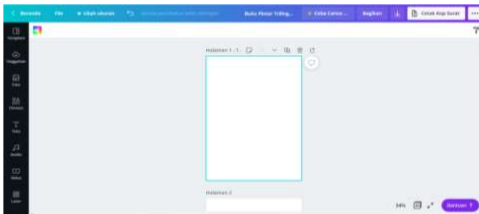
Gambar 2. Tampilan Halaman Kerja Aplikasi

Buku pintar trilingual terdapat tiga bagian utama, yaitu (1) bagian kosakata tiga bahasa agar peserta didik memiliki atau menambah perbendaharaan kata sebelum pembelajaran; (2) bagian cerita yang didukung dengan gambar sesuai dengan kalimat tiga bahasa dalam satu halaman; dan (3) bagian