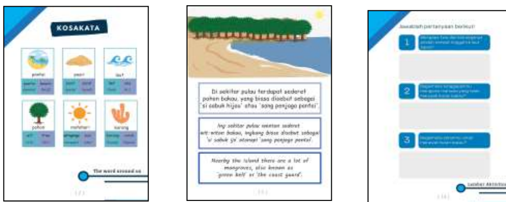
Gambar 3. Tiga Bagian Utama Buku Pintar Trilingual

responding reading melalui beberapa pertanyaan. Tiga bahasa yang digunakan dalam buku pintar trilingual, yaitu bahasa Indonesia, bahasa Jawa dialek Banten, dan bahasa Inggris. Gambar 3 di bawah ini menunjukkan masing-masing bagian dari tiga bagian utama dari buku pintar trilingual.