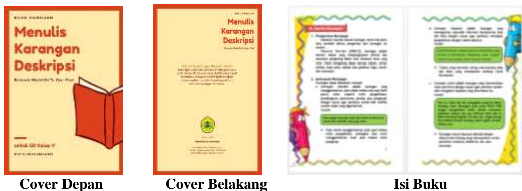
Gambar 1. Tampilan Buku Panduan Menulis Karangan Deskripsi

Setelah desain buku panduan yang dibuat, maka tahap selanjutnya adalah mengubah format desain tersebut dari yang semula berbentuk dokumen (DOC) menjadi bentuk Portable Document Format (PDF). Setelah desain finalnya sudah selesai, desain tersebut kemudian memasuki tahap pencetakan untuk menjadi sebuah buku dalam bentuk fisik. Buku panduan menulis karangan deskripsi dicetak dalam bentuk soft cover dengan menggunakan jenis kertas HVS berukuran 17,6 cm x 25 cm atau ukuran B5. Berikut tampilan buku panduan menulis karangan deskripsi.