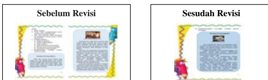
Gambar 3. Contoh Teks Deskripsi

Berikut ini salah satu tampilan pada buku panduan menulis karangan deskripsi yang telah melalui tahap revisi.