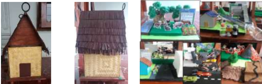
Gambar 2. Media Ruliba Berbasis Kearifan Lokal Pada Pembelajaran Keseimbangan Ekosistem

Tampilan awal pada media ruliba ini berdesain rumah adat suku Baduy yang terdiri dari 2 bagian yaitu bagian atap dan bagian badan media yang memiliki 4 sisi dapat dibuka tutup. Bagian atap dan sisi media ini menyajikan diorama dari faktor-faktor yang mempengaruhi keseimbangan ekosistem dan dampaknya terhadap jejaring makanan desain produk, pembuatan media ruliba dengan materi yang sudah ditentukan berdasarkan data-data yang telah dikumpulkan sebelumnya. Adapun materi yang disajikan dalam media ruliba ini adalah materi tentang keseimbangan ekosistem.