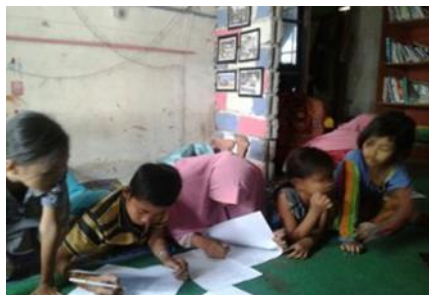
Gambar 2. Fasilitas Belajar Anak-Anak di TBM

Terbatasnya koleksi buku buku juga menjadi kendala tersendiri dalam memajukan TBM. Hingga saat ini koleksi buku TBM hanya mengandalkan sumbangan dari donatur dari luar daerah dan swadaya anggota secara mandiri. Tidak banyak koleksi buku yang dimiliki TBM. Rata-rata buku sumbangan merupakan terbitan lama. Implikasinya sebagian besar anak-anak tidak berminat lagi untuk membaca. Berdasarkan hasil wawancara dengan salah satu aktivis literasi di Lombok Tengah memang ada beberapa kali bantuan buku dari Balai Bahasa tetapi jumlahnya tidak mencukupi untuk memenuhi kebutuhan semua TBM yang ada. Kendala internal terakhir yang dihadapi adalah masalah pendanaan. Dana menjadi permasalahan yang serius dalam kelancaran kegiatan TBM.