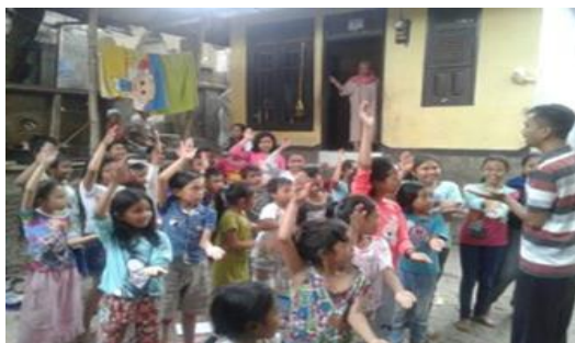
Gambar 1. Aktivitas Anak-Anak di TBM

Melihat realitas semacam ini pemuda-pemuda terpelajar berusaha merubah paradigma masyarakat tentang budaya literasi. Para pemuda ini berasal dari berbagai macam profesi, namun sebagian besar dari mereka adalah alumnus perguruan tinggi sehingga memiliki wawasan yang luas tentang pentingnya budaya literasi. Salah satu langkah konkret pemuda desa dalam menumbuhkan budaya literasi masyarakat adalah dengan mendirikan taman bacaan masyarakat (TBM). Salah satu pendiri TBM ketika diwawancarai mengatakan bahwa para pemuda berkomitmen untuk mencerdaskan anak bangsa melalui kegiatan literasi. Para pemuda memiliki cita-cita yang sangat mulia dan turut serta dalam membangun dan menyiapkan generasi muda bangsa. Tidak lain tujuannya adalah agar anak bangsa kelak dikemudian hari menjadi generasi yang cerdas dan terampil, kreatif dan inovatif, handal dan kompetitif.